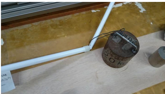
竿の破損部分 (竿の合わせ部分)