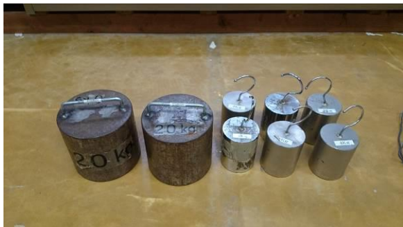
重り（大 20kg/個、小 4kg/個）