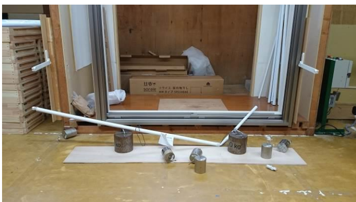
60kgf 負荷 竿の合わせ部分に負荷後破損する。